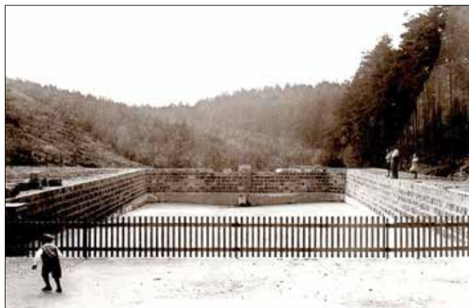
Das Waldbad im Bau

Mit der Entschlammung des Teiches begann im Winter 1931/32 der Bau. 45 bis 50 Männer arbeiteten hier für einen Stundenlohn von zwanzig Pfennigen. Die benötigten Sandsteine konnten von ihnen im nahen Steinbruch am Grundweg gebrochen werden. Ein Teil des für die Umkleidekabinen benötigten Holzes wurde aus den im Badgelände geschlagenen Bäumen geschnitten. Bei der Eröffnung der Einrichtung beliefen sich die Kosten der Gemeinde Schöna auf etwa 9200 Mark.