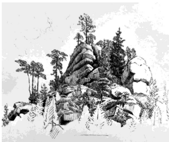
Felsen und Bäume

Unter dieser Sicht wage ich einen Versuch zu dieser genannten Felsstudie. Am Püschelweg, der Bestandteil des "C.-D.-Friedrich-Weg" es ist, erreicht man oberhalb des Wohn- und Ferienhauses "Eulenburg" die Stationstafel 11. Vom nahen Umfeld dieses Standortes aus könnte C.D.Friedrich gezeichnet haben. Auf dem gegenüberliegenden Talhang, etwa höhengleich und 300 Meter entfernt, liegt ein abgeflachter Sandsteinklotz in der Ausdehnung von etwa 8 mal 4 Metern auf der abschüssigen Hangfläche, wenige Meter oberhalb des vorbeiführenden Krippener Rundweges. Der heutige starke Bewuchs verhindert, auch in der Winterzeit, den Blick auf diesen Felsen von diesem Standort aus. Das Fotografieren eines Vergleichsbildes entfällt damit. Lediglich beim Umrunden des Steines lassen sich einige Merkmale ausmachen, die einer Lokalisierung nützen, wie die abgelösten Felsblöcke am Fuß des Felsüberhanges (siehe Foto), die teilende Schichtfuge, die anhaftende Steinplatte an der rechten Wandseite (jetzt abgefallen und eingewachsen). - Eine Diskussionsgrundlage zu der Felsstudie wäre damit geschaffen.