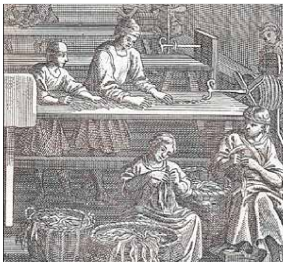
Tabakmanufaktur um 1690