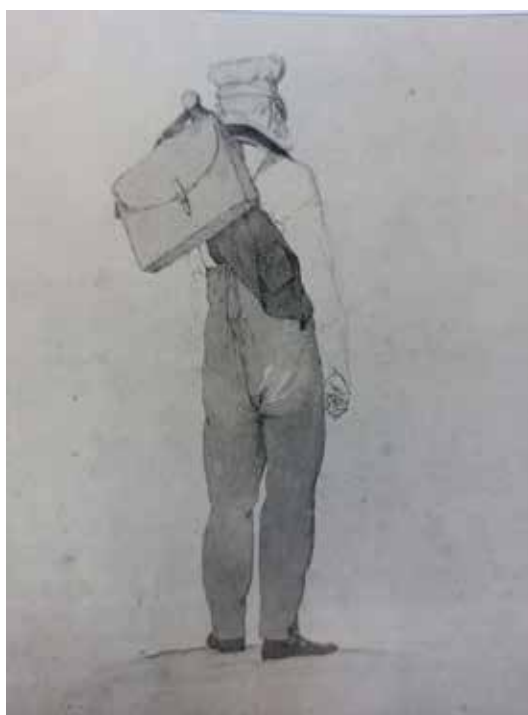
Der wandernde C.D.Friedrich, gezeichnet von G.F.Kersting

Diese Zahl verliert sich in der Fülle seines hinterlassenen Schatzes von ca. 1000 Zeichnungen 2). Jedoch ist das eine beachtliche Anzahl für das damals kleine Dorf an der Elbe. Im Kriegsjahr 1813 flüchtete C.D.Friedrich aus Dresden nach Krippen 3). Die Wirrnisse und Ängste in dieser unsicheren Zeit verschonten auch den Ort nicht. Diese Umstände zwangen den leidenschaftlichen Wanderer und Naturliebhaber, sich in der näheren Umgebung aufzuhalten und dort Motive zu finden und zu zeichnen.