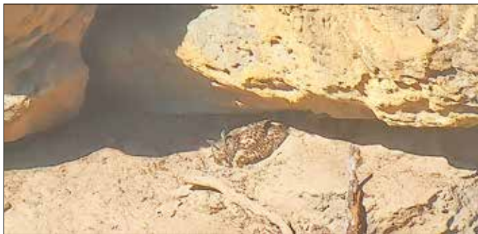
Das Foto ist mit großer Vergrößerung durch ein Spektiv aus großer Entfernung entstanden.

Zum Schutz der Bruten weist die Nationalparkverwaltung Horstschutzzonen aus. Nur selten sind Wanderwege davon betroffen, häufiger aber Zugangswege zu Kletterfelsen und einzelne Kletterrouten. Die erfahrenen Spezialisten der Nationalparkverwaltung legen die Schutzzonen so klein wie möglich aus, um den Klettersport möglichst wenig einzuschränken. Manche der Horstplätze im Landschaftsschutzgebiet werden sogar ehrenamtlich von Kletterern bewacht. Umso wichtiger ist es, dass die dort angebrachten Schilder an Ort und Stelle verbleiben und nicht verdreht werden. „Das Überleben dieser Tierarten in der Sächsischen Schweiz steht auf dem Spiel“, unterstreicht Augst abschließend.