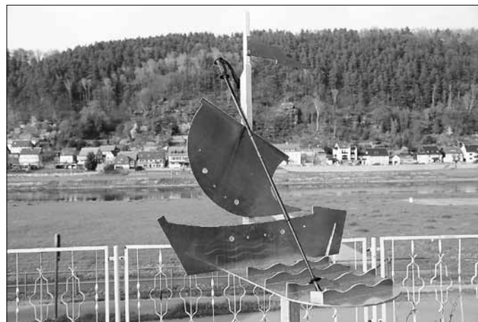
Die dreißigste Uhr von 2014, angefertigt vom Metallbau Gunter Arnold

Der Krippener „SonnenUhrenWeg“ erweitert sich mit dieser Schiffsuhr auf 30 beschriebene Standorte. Eine stattliche Anzahl für den kleinen Ort. In dem zeitlich befristeten staatlichen Förderprojekt von 2005 bis 2007 waren ursprünglich 20 Uhren vorgesehen. Dank des breiten Echos bei den Einwohnern und deren Mitwirkung gelang es, ein in seiner Art einmaliges kulturelles und touristisches überregionales Angebot termingerecht anzubieten. In den nachfolgenden Jahren konnte der „SonnenUhrenWeg“ um weitere 10 Exemplare ergänzt werden