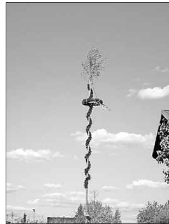
Unser Maibaum 2011

Ihre Freiwillige Feuerwehr Rathmannsdorf und Ihr Feuerwehrverein Rathmannsdorf e. V.