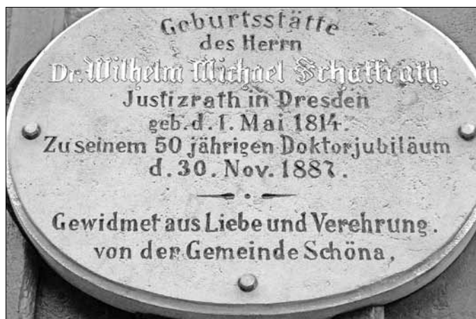
Gedenktafel am Haus Nr. 91 in Schöna

1871 war er bei der Gründung des Deutschen Anwaltsvereins dabei und er war Vorsitzender des Dresdener Anwaltsvereins. Nach der Gründung der Sächsischen Anwaltskammer 1876 wurde er zu deren Vorsitzenden gewählt und verblieb in diesem Amt bis 1891. Am 7. Mai 1893 verstarb Wilhelm Michael Schaffrath. Bis zu seinem Lebensende blieb er den politisch-sozial Unterdrückten und Verfolgten solidarisch verbunden. In einem Nachruf rühmte man ihn, dass er zu den gesuchtesten Anwälten Sachsens gehörte. Für seinen Geburtsort Schöna, dem er sich sehr verbunden fühlte, übernahm er erfolgreich mehrmals die Vertretung in juristischen Angelegenheiten. Aus Anlass des 50. Doktorjubiläums am 30. November 1887 bracht die Gemeinde Schöna an seinem Geburtshaus eine Gedenktafel an.