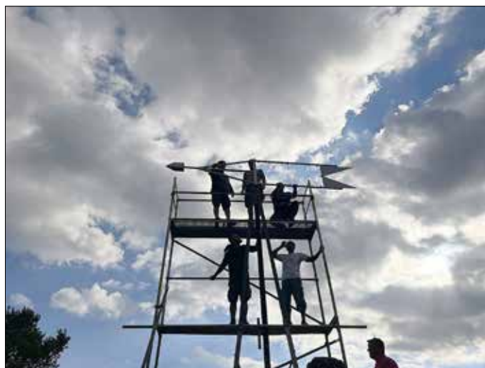
Montage der neuen Wetterfahne am 8. Juli 2022

Inzwischen ließ sich abermals eine Instandsetzung nicht umgehen. Die in die Jahre gekommene Wetterfahne drehte sich nicht mehr. Der Abbau der gesamten Anlage erfolgte im September des Jahres 2021. Spektakulär war dabei, dass diese Arbeiten mit Hilfe eines Hubschraubers bewerkstelligt werden konnten. Für die Montage der neuen Metallkonstruktion, im Juli 2022, musste ein sechs Meter hohes Gerüst errichtet werden. Das Landschaftsbild in der Wetterfahne, nun farbig gestaltet, erhielt wieder seinen angestammten Platz. Diese neuerlichen Arbeiten geschahen auf Initiative von Udo Löser, der auch die Kosten dafür übernahm.