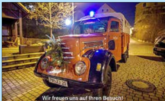
Wir freuen uns auf Ihren Besuch!

Weitere Informationen finden Sie auf unserer Seite bei Face- book https://www.facebook.com/FeuerwehrPorschdorf