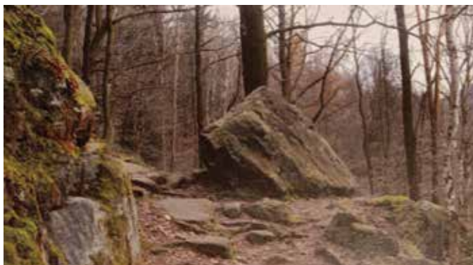
Auf dem Püschelweg bei Krippen

Krippen, ein Stadtteil von Bad Schandau, konnte den wichtigen Hinweis liefern. Der suchende F. Richter war hier erfolgreich. Er lokalisierte den Ursprung des Bildes am Püschelweg. 2)