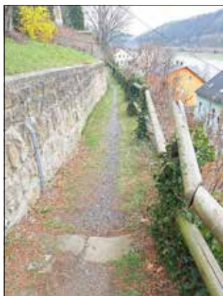
hier das Geländer vor Baubeginn