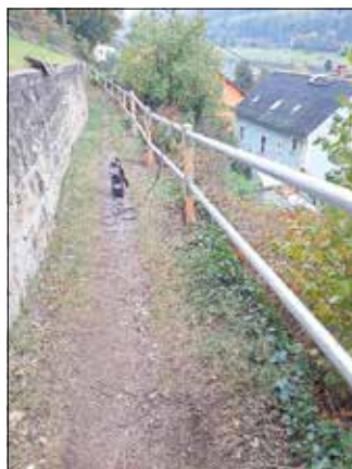
das neue Geländer an der Kirschleite

Im Stadtteil Postelwitz am Ausgang „Kirschleite“ war das Geländer in einen katastrophalen Zustand.