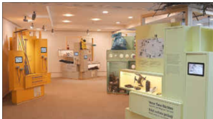
Neuer Ausstellungsbereich im NationalparkZentrum, der am 14. März eröffnet wird

Eindrucksvoll bebildeter kunstgeschichtlicher Vortrag über die sächsische Landschaftsmalerei der Romantik, deren Wurzeln und besondere Ausprägung bei Caspar David Friedrich; Dr. Anke Fröhlich-Schauseil (Kunsthistorikerin); Anmeldung nicht erforderlich