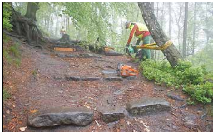
Foto: Sachsenforst - Mitarbeiter der Nationalparkverwaltung sa- nieren den Nordaufstieg auf den Lilienstein. Im Schnitt alle sieben Jahre müssen die Steiganlagen aus Holz erneuert werden. Neben ei- nem besseren Aufstieg für die Besucher halten die Stufen und Tritte Wasser und Sand zurück.

Foto: Sachsenforst - Eine erfahrene Fachfirma aus der National- parkregion passt das Holzgeländer in den sensiblen Standort auf dem Liliensteinplateau ein. Für Besucher wird sich ein qualitätsvol- leres Naturerlebnis einstellen. Die sensible Beerstrauchheide wird sich erholen, weil weniger Trittschäden durch immer wieder neue Abkürzungen entstehen.