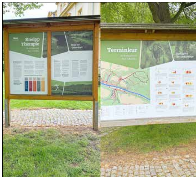
Tafeln „Startpunkt Terrainkurwege“