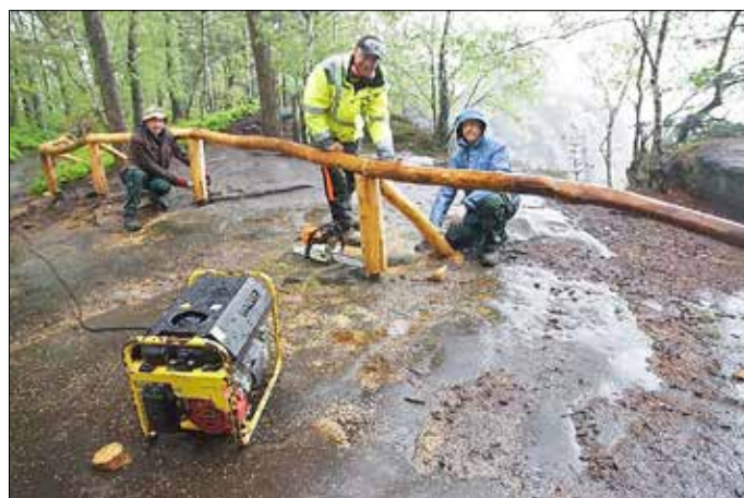
Eine erfahrene Fachfirma aus der National- parkregion passt das Holzgeländer in den sensiblen Standort auf dem Liliensteinplateau ein. Für Besucher wird sich ein qualitätsvol- leres Naturerlebnis einstellen. Die sensible Beerstrauchheide wird sich erholen, weil weniger Trittschäden durch immer wieder neue Abkürzungen entstehen.