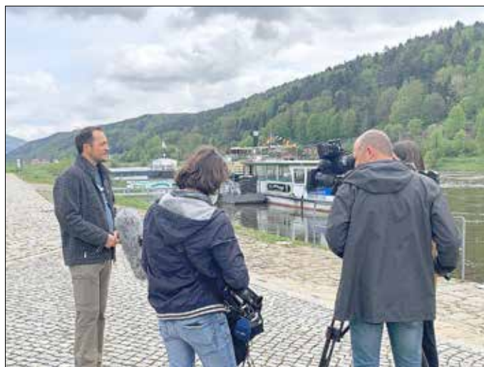
Bürgermeister Thomas Kunack im Interview mit dem MDR

Gemeinsame Pressemitteilung des Landratsamtes und des Tourismusverbandes Sächsische Schweiz: