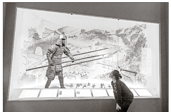
Foto „Militärhistorische Objekte“: Besucherin vor militärhistorischen Objekten.

weitere Informationen unter www.festung-koenigstein.de und www.njcitywall.com