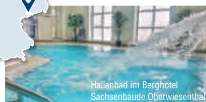
Hallenbad im Berghotel Sachsenbaude Oberwiesenthal