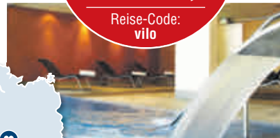
Beispiel Doppelzimmer Stammhaus

Traditionelle & kreative Küche mit regionalen Zutaten