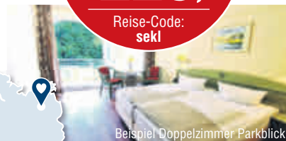
Beispiel Doppelzimmer Parkblick