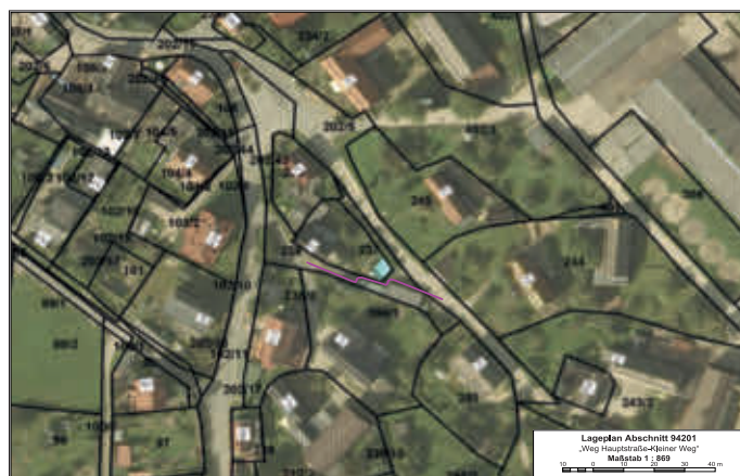
Lageplan Abschnitt 94201 „Weg Hauptstraße-Kleiner Weg“

Der Haushaltsplan für das Haushaltsjahr 2025/2026, der die für die Erfüllung der Aufgaben der Gemeinde voraussichtlich anfallenden Erträge und entstehenden Aufwendungen sowie eingehenden Einzahlungen und zu leistenden Auszahlungen enthält, wird: