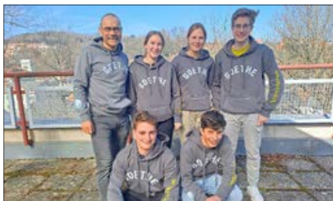
Die Laufgruppe beim Shooting auf dem Dach der Schulturnhalle

Goethe-Gymnasium Sebnitz/Schulleitung/Tel.: 035971 53779