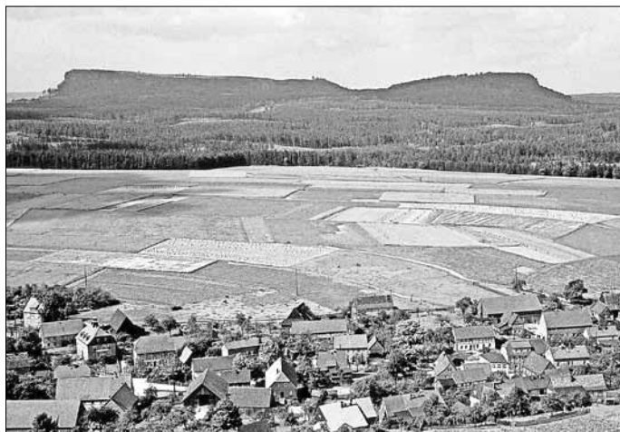
Ansichtskarte um 1950, Schöna und die Zschirnsteine