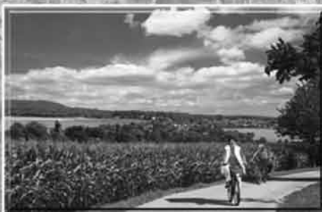
Blick auf Lohmen