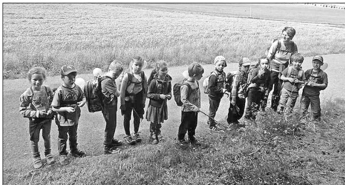
Gruppe am Feld in Papsdorf