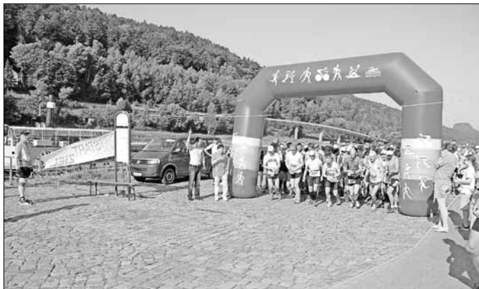
Startschuss des 30-km-Laufs