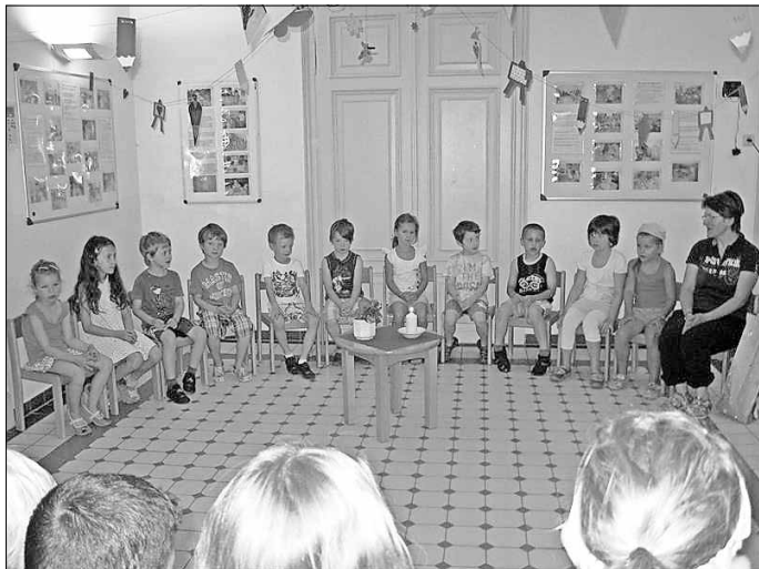
Schulanfänger sitzen in der großen Eingangshalle