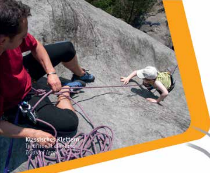
Klassisches Klettern Traditional climbing Tradiční lezení