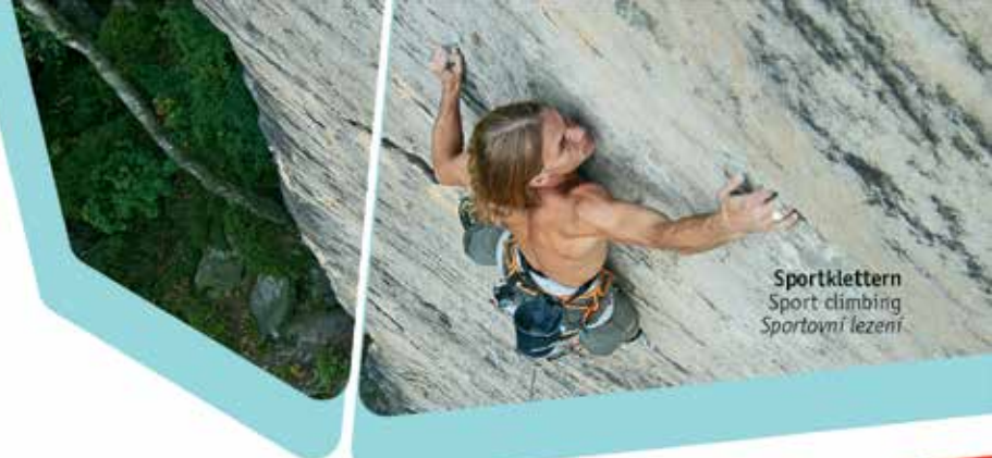
Sportklettern Sport climbing Sportovní lezení